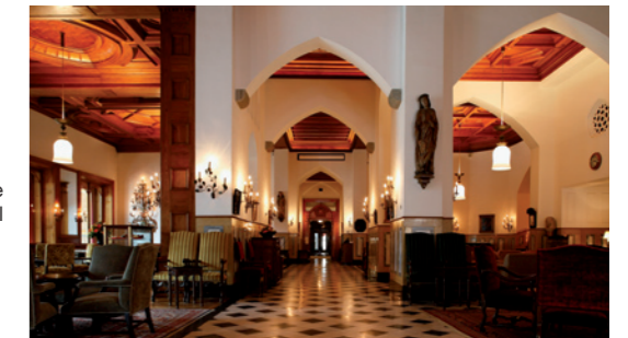
Badrutt's Palace Le Grand Hall