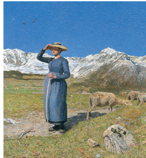
Windiger Tag von Giovanni Segantini