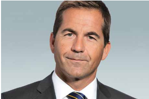
Walter Thurnherr Vorstandsmitglied SMG, Generalsekretär UVEK

Walter Thurnherr ist seit Januar 2011 als Generalsekretär im Eidgenössischen Departement für Umwelt, Verkehr, Energie und Kommunikation (UVEK) tätig. Die Funktion des Generalsekretärs nahm er zuvor im Eidgenössischen Departement für auswärtige Angelegenheiten (EDA) und im Eidgenössischen Volkswirtschaftsdepartement (EVD) wahr. Von 1995 bis zum Frühjahr 1997 arbeitete Walter Thurnherr mit dem Titel eines Ministers bei der Schweizerischen Botschaft in Moskau. Vom März 1997 bis Mai 1999 war er der persönliche Mitarbeiter von Bundesrat Flavio Cotti. Darauf war er Minister und stellvertretender Chef der Politischen Abteilung VI, bis er im Mai 2000 zum Botschafter und Chef dieser Abteilung ernannt wurde. Walter Thurnherr hat sein Studium in theoretischer Physik an der ETH Zürich abgeschlossen.